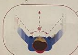
ОПАСНОЕ ТУННЕЛЬНОЕ ЗРЕНИЕ

При переходе проезжей части обязательно держите ребенка за руку и первым делом научите его смотреть по сторонам: сначала налево, потом направо, а дойдя до середины дороги – снова направо!