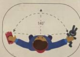
НОРМАЛЬНОЕ БОКОВОЕ ЗРЕНИЕ

Если ребенок не видит игрушки по бокам и не может определить их цвет – это признаки туннельного зрения. Рекомендуется обращение к офтальмологу и неврологу